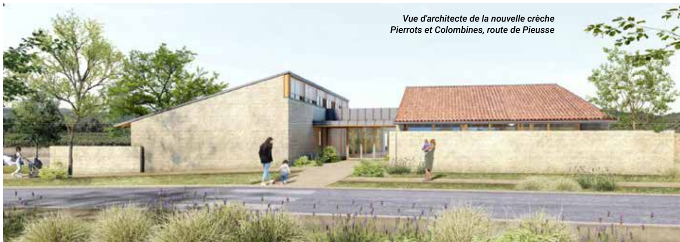
Vue d'architecte de la nouvelle crèche Pierrots et Colombines, route de Pieusse

Enfin, dans le cadre de la sécurisation de la circulation, le programme de goudronnage 2023 à hauteur de 400 000 € est maintenu. Un large programme de sécurisation de la traversée de la ville par la D118 sera également effectué avec des passages piétons surélevés et une signalétique lumineuse pour appeler les automobilistes à la vigilance.