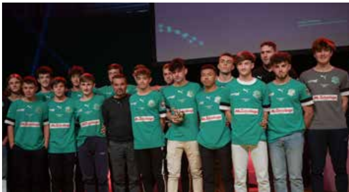
Performance collective pour les U17 du Football Club