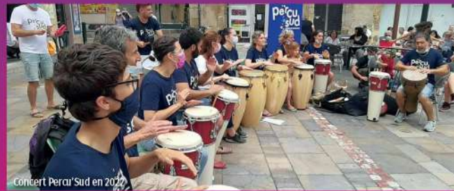
Concert Percu'Sud en 2022