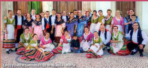
Coros y Danzas Santísima Cruz de Abanilla - Murcia